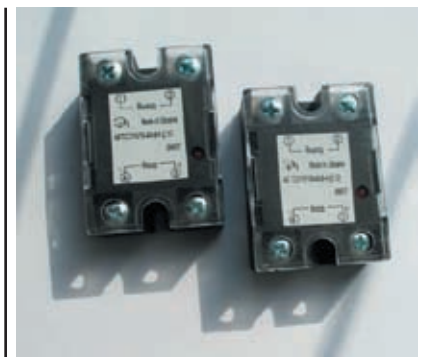
Рисунок 2 Внешний вид модуля МТСО15/18